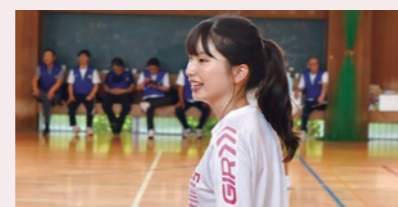
イベント時の様子