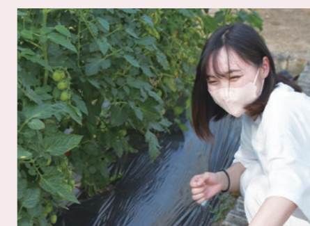
一緒に作物を収穫している様子