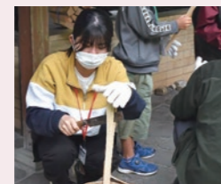
学生企画キャンプ