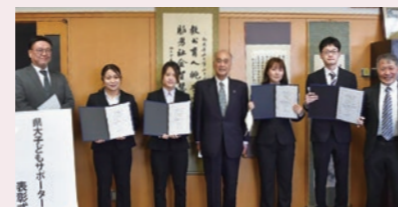
サポーター表彰式