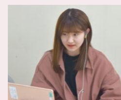
オンラインボランティア(学校)

これらの活動から、子どもを支援する際の基本的な関わり方や 集団での役割を遂行する力、継続的な支援を行うためのマネジメント能力 を身につけます。